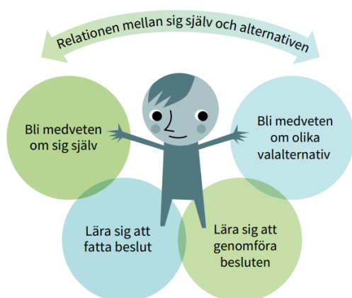
Figur 2: Det finns flera komponenter som bidrar till elevens valkompetens. Det handlar till exempel om att bli medveten om sig själv, om olika valalternativ samt om att lära sig att fatta beslut och att genomföra besluten. 8